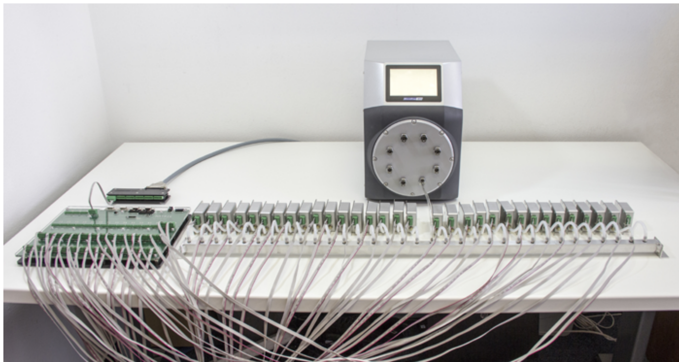
Калибровка 32 барометров с коллектором и калибратором давления Pressurewell